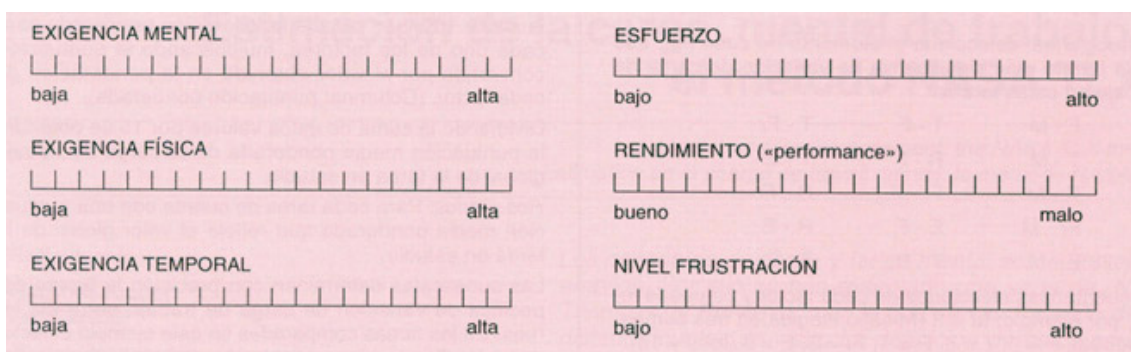
Figura 3 Escalas de puntuación

En esta fase de puntuación, las personas valoran la tarea o subtarea que acaban de realizar en cada una de las dimensiones, marcando un punto en la escala que se les presenta. Cada factor se presenta en una línea dividida en 20 intervalos iguales (puntuación que es reconvertida a una escala sobre 100) y limitada bipolarmente por unos descriptores (por ejemplo: elevado/bajo, como muestra la fig. 3) y teniendo presentes las definiciones de las dimensiones.